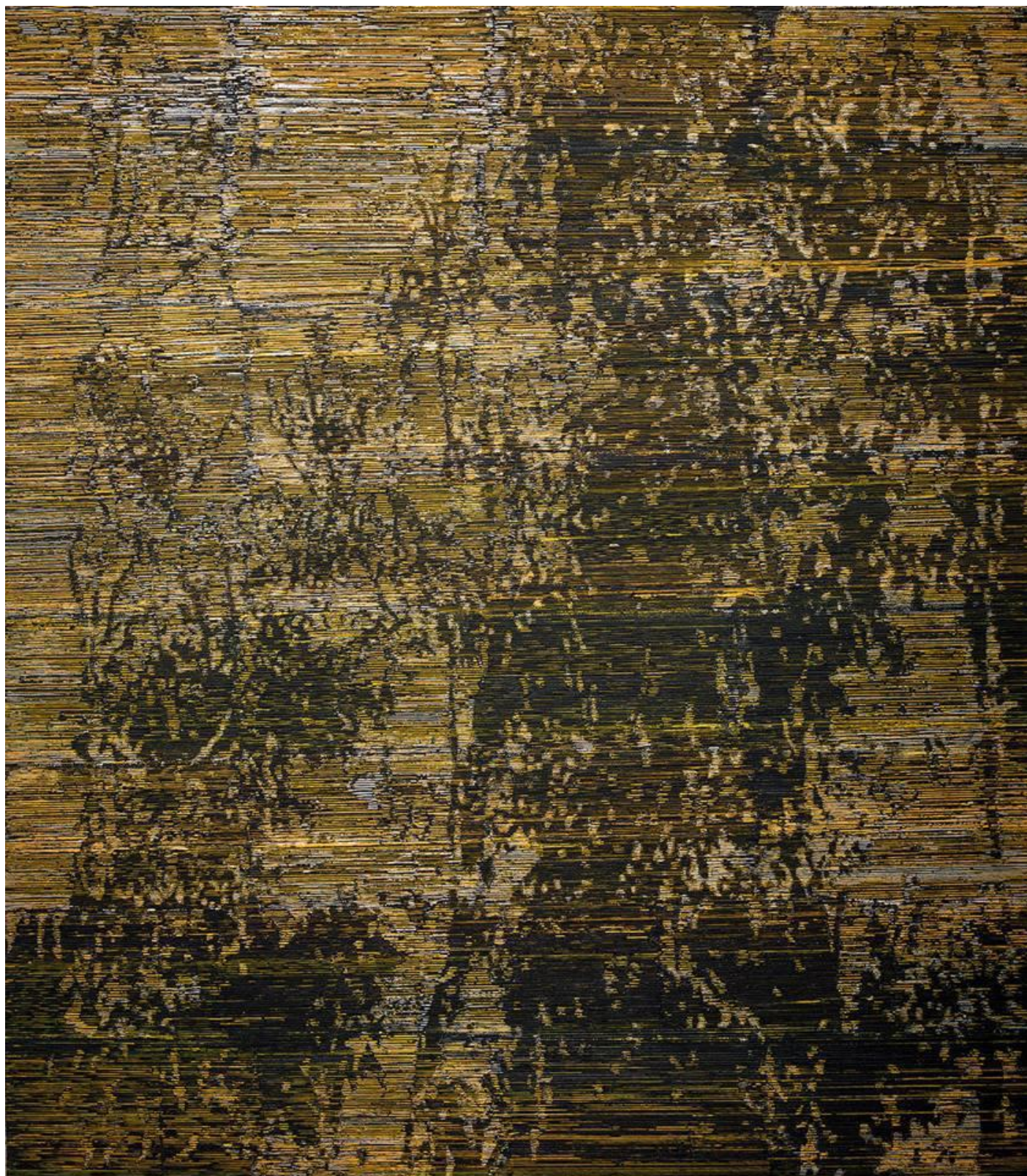
Sin título 2013 Acrílico sobre lienzo 170 x 150 cm