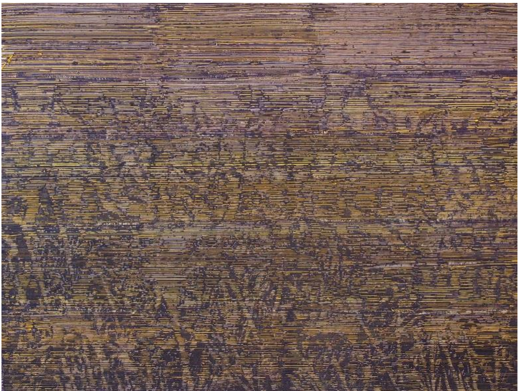
Sin título 2013 Acrílico sobre lienzo 130 x 97 cm