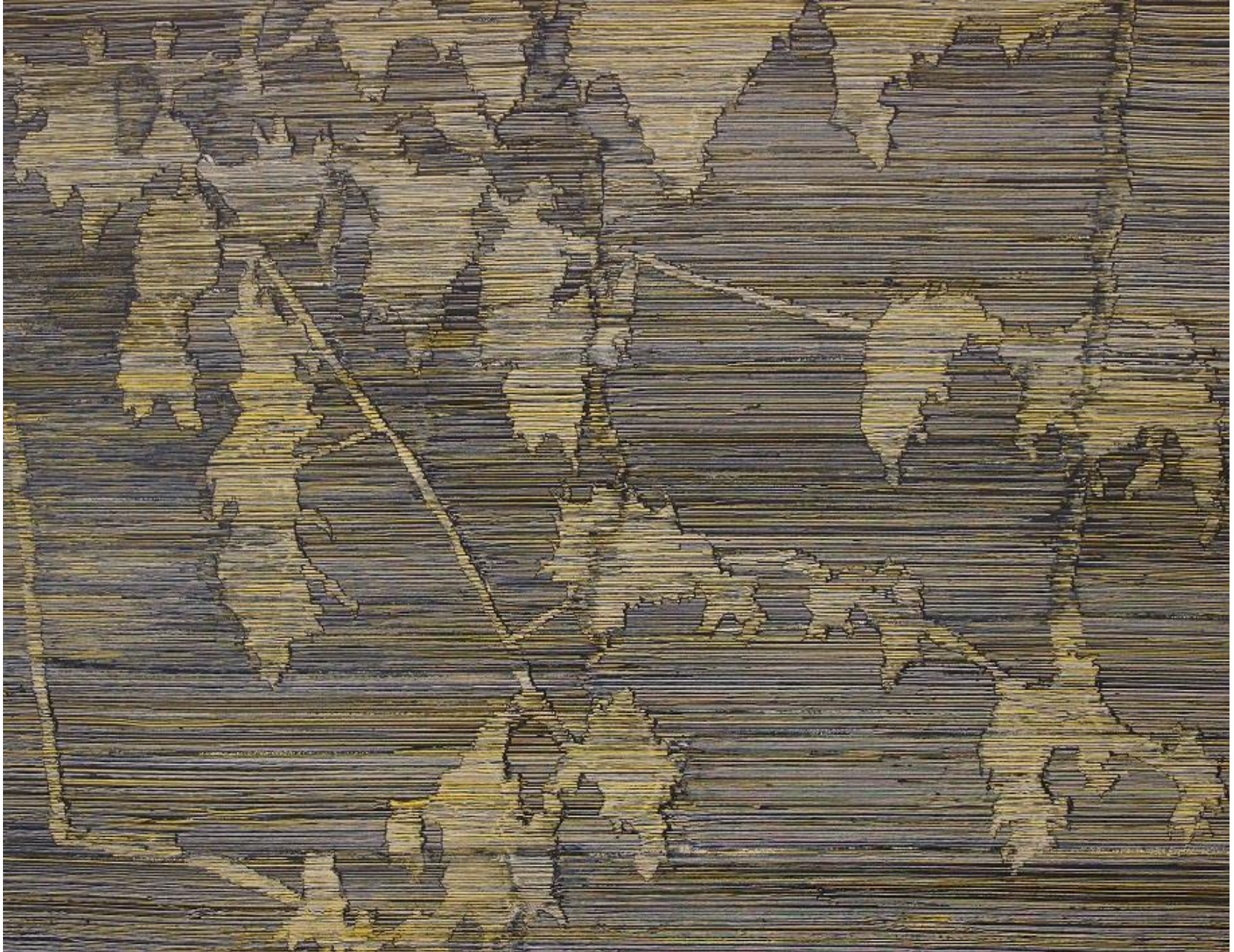
Sin título 2013 Acrílico sobre lienzo 116 x 89 cm