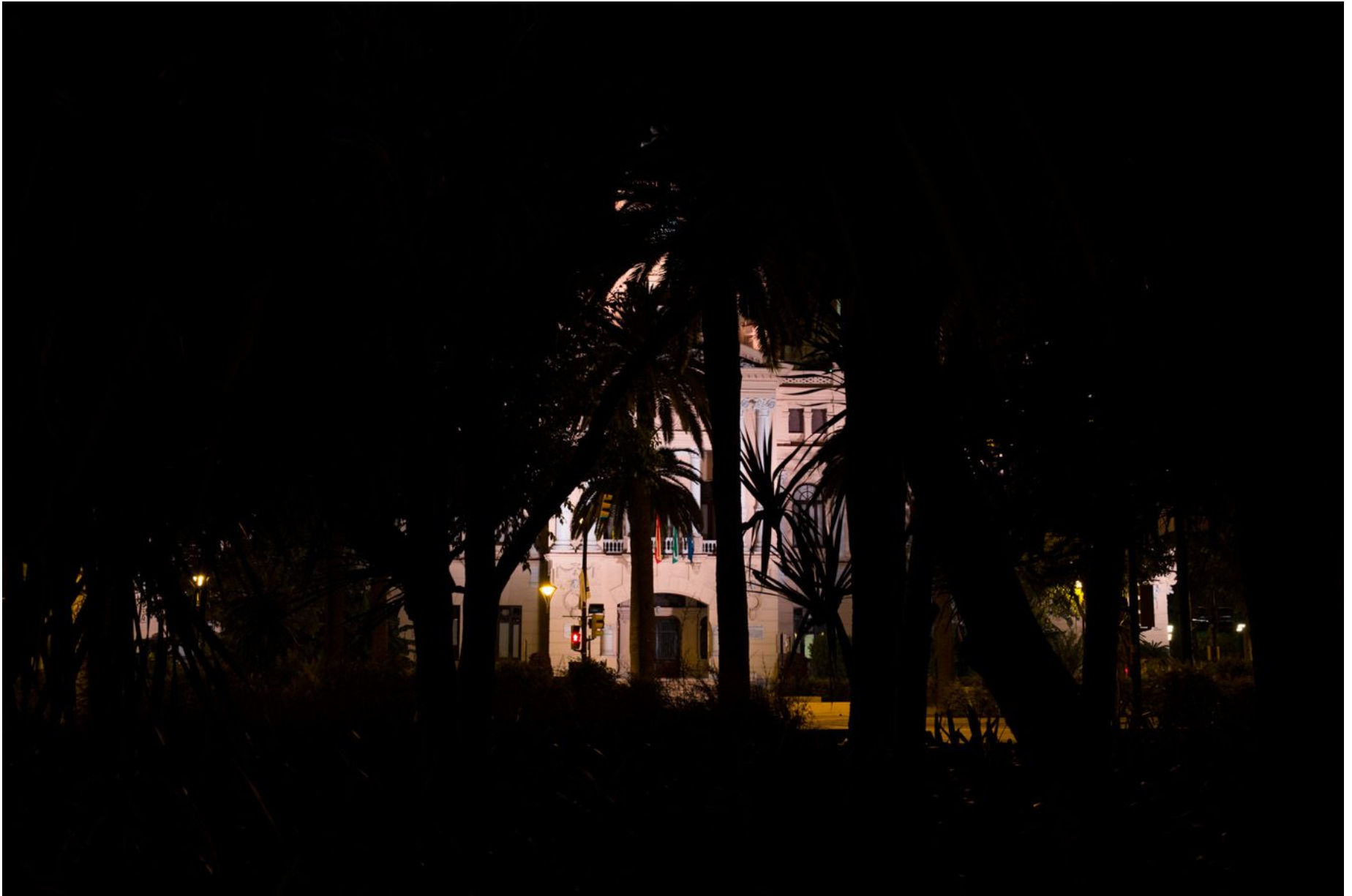
AYUNTAMIENTO Fotografía, 100x150 cm, 2015