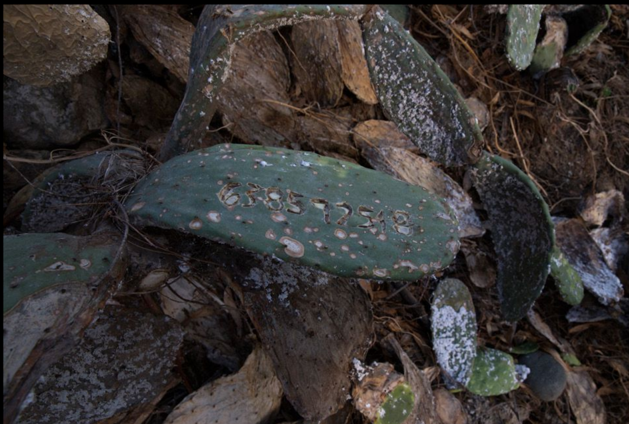
638592518 Fotografía, 80x100 cm, 2015