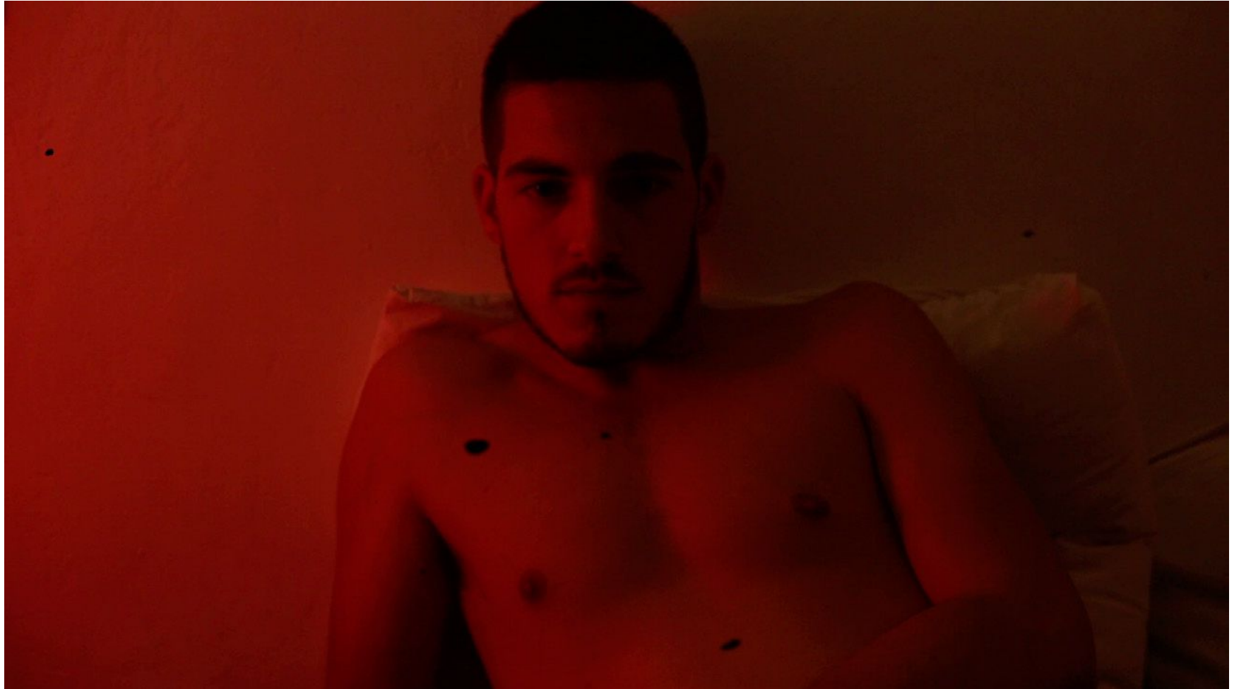
CARLOS Video, 01'48", 2015