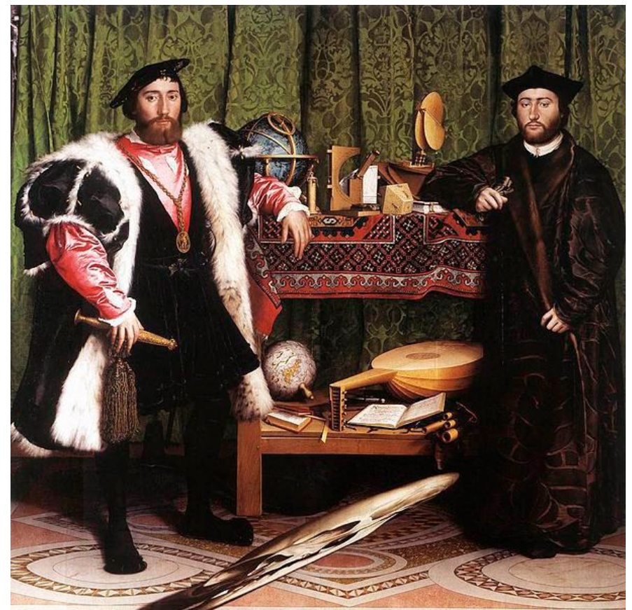
Hans Holbein el Joven, Los embajadores Óleo sobre lienzo, 207x210 cm, 1553

Voy por pasos. Tengo en mente el seminario XI de Lacan, Los cuatro principios fundamentales del psicoanálisis , concretamente, el capítulo que lleva por título “La anamorfosis”. Y no es que precisamente vea en las imágenes del parque ninguna estructura extraordinaria o calavera de-formada , como en el caso de la célebre obra Los embajadores de Hans Holbein (1553) analizada por el psicoanalista. Aquí, en el parque, no hay nada más que lo que realmente es: una estructura o paisaje simbólico dispuesta para el paseante, pero no para cualquiera. De hecho, a pesar de que alguna de la obras parecen retratos, me aventuro a pensar que verdaderamente ninguno lo es. Paneles, capas verdes de follaje, túneles ornamentados, una luz intermitente, estos son los elementos con