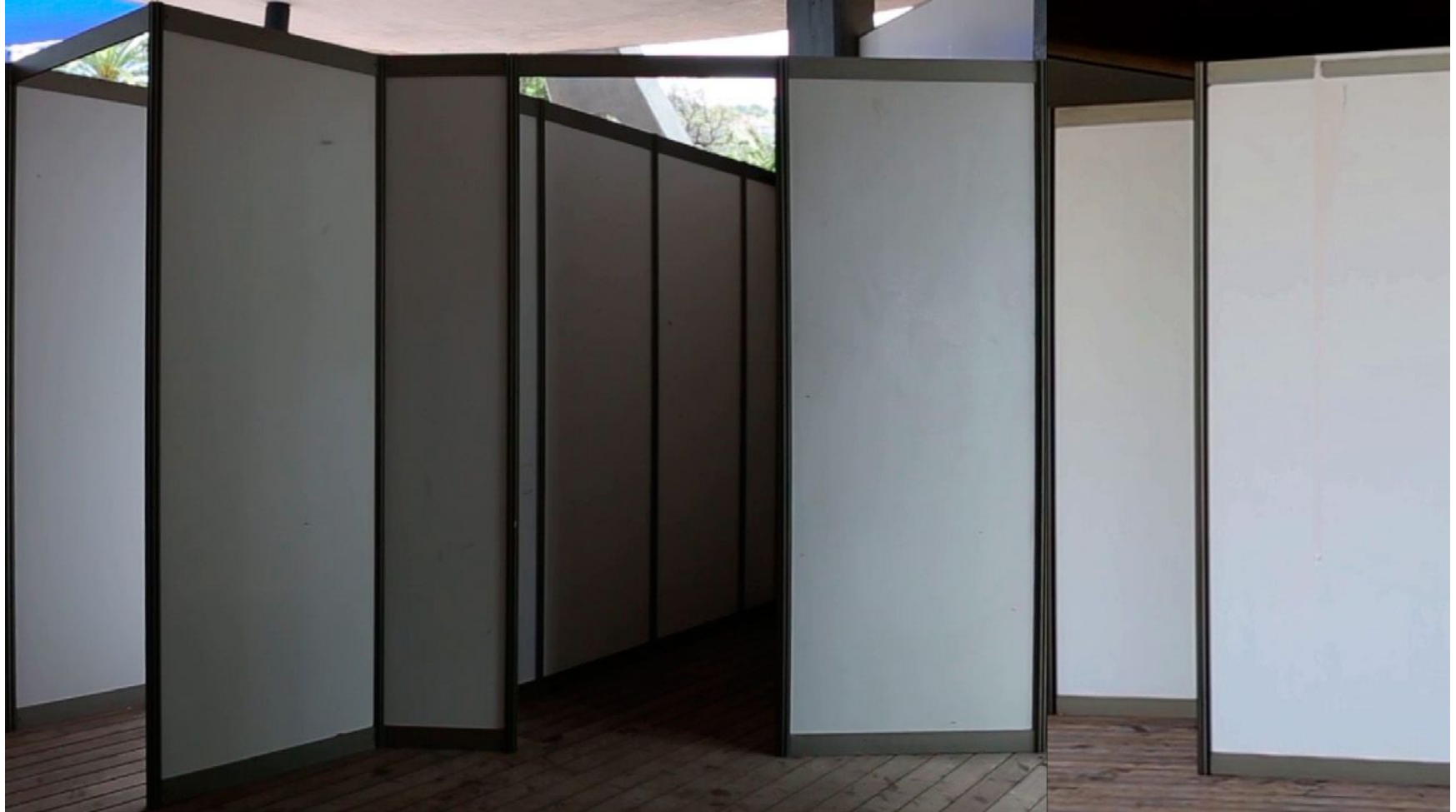
Sin título Vídeo, 02'29", 2015