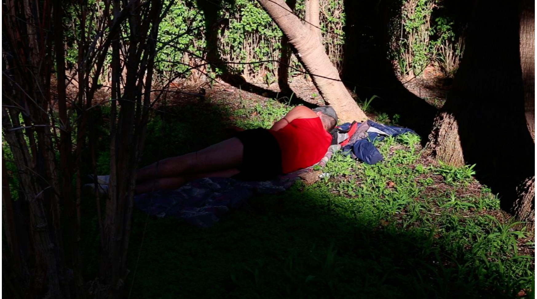
Sin título Video, 03'45", 2014