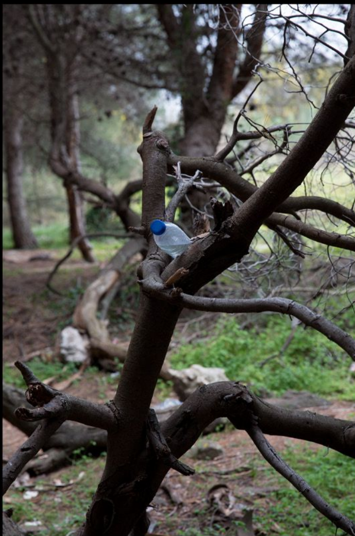
Sin título Fotografía, 40x30 cm, 2015