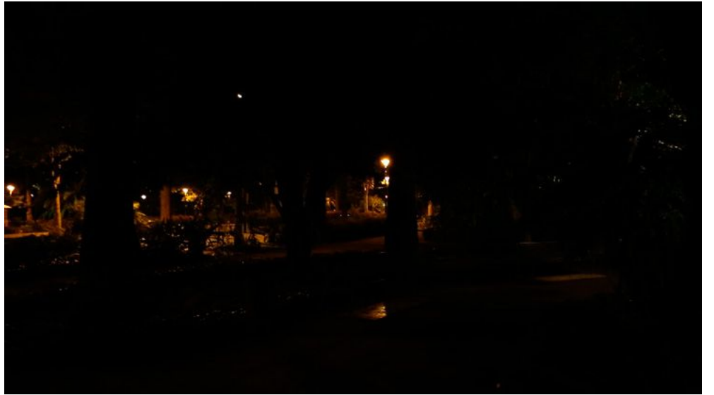
PASEOS DEL PARQUE Díptico videográfico, 10'42", 2015