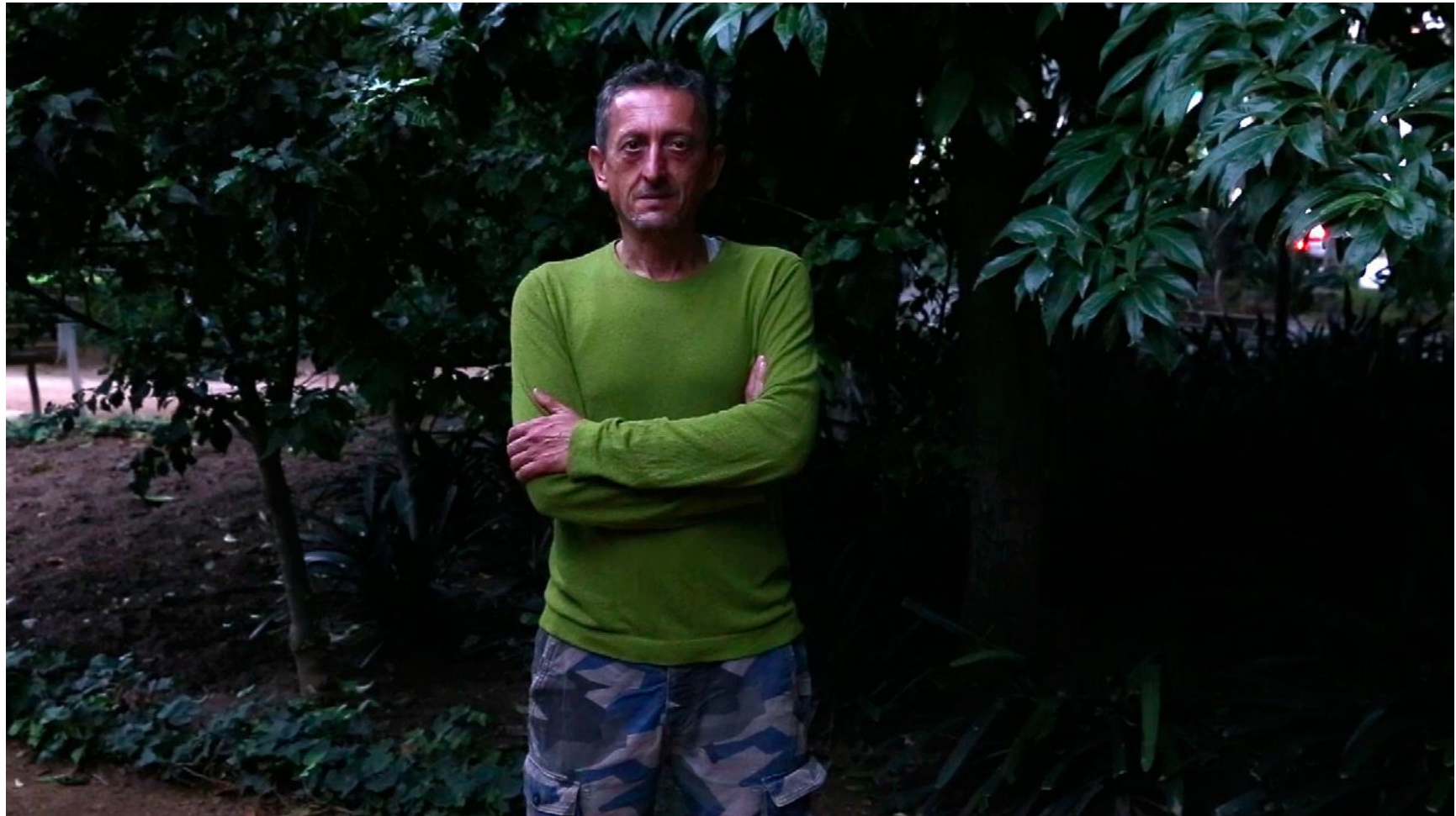
SIN NOMBRE (15 SEGUNDOS) Video, 09'21", 2014/2015